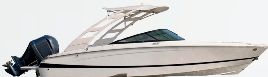
1º Prêmio: Lancha motorboat Evinrude 225

Sorteio 30/11/2022 pela extração da Loteria Federal