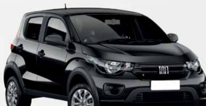
2º Prêmio: Fiat Mobi EASY 1.0 FLEX MANUAL, Ano 2021, Modelo 2022