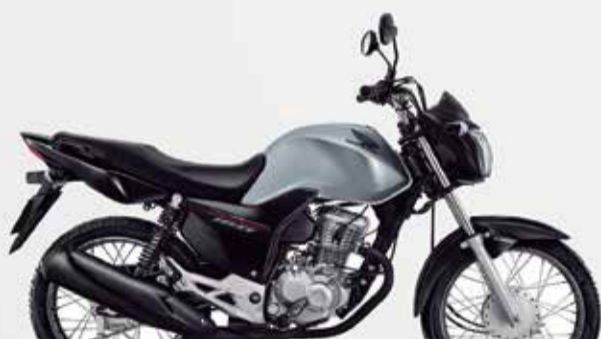
3º Prêmio: Motocicleta CG 160cc START - Ano/Modelo 2022