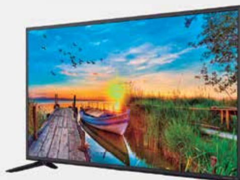
4º Prêmio: Televisor 43'