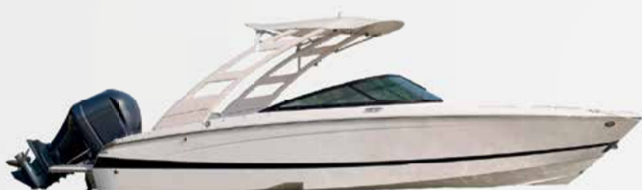
1º Prêmio: Lancha motorboat Evinrude 225

Sorteio 30/11/2022 pela extração da Loteria Federal