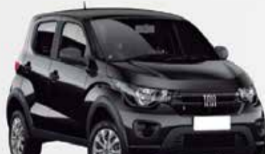
2º Prêmio: Fiat Mobi EASY 1.0 FLEX MANUAL, Ano 2021, Modelo 2022