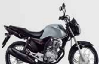
3º Prêmio: Motocicleta CG 160cc START - Ano/Modelo 2022