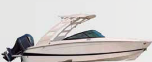
1º Prêmio: Lancha motorboat Evinrude 225

Sorteio 30/11/2022 pela extração da Loteria Federal