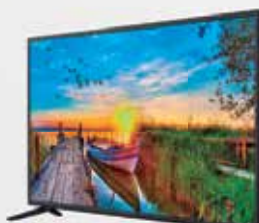
4º Prêmio: Televisor 43"